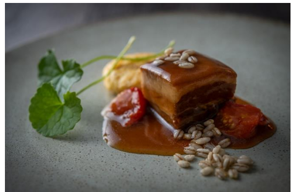
東坡肉（豚の三枚肉）