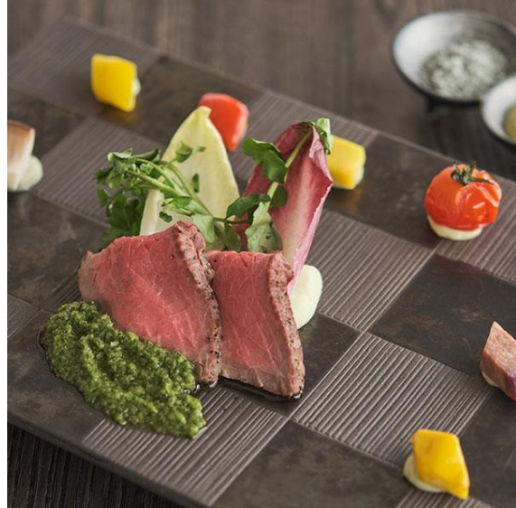
写真左から、フサキガーデンサラダ、石垣牛のローストビーフ 葱ユーグレナソース