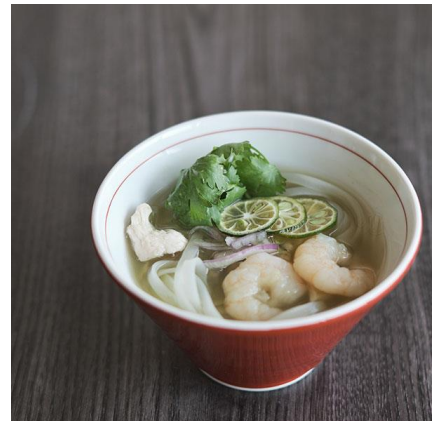
写真左から、アグー豚 二色の琉球小籠包とフカヒレのヌチグスイ薬膳スープ、アカマチのマス煮 ユーグレナの出汁、ユーグレナとシークワサー風味のフォア