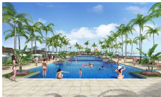
アクアガーデン（ビーチサイドプール）

フサキリゾートヴィレッジ ビーチ&ガーデンは、1982年7月に開業。石垣島の西海岸に面し、島内随一のサンセットが楽しめるほか、ウミガメが産卵に訪れる天然ビーチが目の前にあることも魅力の施設です。敷地内にはハイビスカスやヤシの木など亜熱帯植物に囲まれたガーデン、サンセットや満天の星空が楽しめる栈橋「Fusaki Angel Pier（フサキ エンジェル ピア）」もあり、ゆったりと流れる島時間を楽しみながら大自然を体感できるリゾートホテルとして、これまで国内外から多くの旅行者にご利用いただいています。