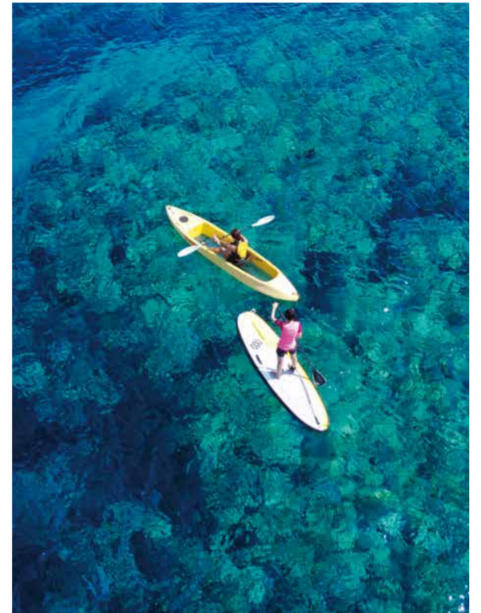
カヤックを漕ぐ楽しさと、クリアな底面から海中のサンゴや色とりどりの魚たちが観察できる「クリアカヤック体験ツアー」。インストラクターがポイントまでご案内します。

自然豊かなフサキにとって、圧倒的の魅力はその美しい海にあります。石垣島最大の湾である名蔵湾に面し、於茂登岳から森の恵みを受け、起伏に富んだ海底では、2024年の海水温上昇も耐え抜いたサンゴのこどもたちが美しい海中風景を生み出しています。透明度の高い海ではシュノーケルツアーをはじめ、スタンドアップパドルやクリアカヤック、グラスボートでの周遊クルージングなど、島内有数の海中世界へとアプローチできるマリンスポーツアクティビティがおすすめです。今年は3月15日、西表島のトゥドゥマリ浜で開催される「八重山の海開き」を皮切りに、海浜で身を清め健康を祈願する「ハマウリ（浜下り）」や、豊漁と海上安全を祈願する「海神祭・ハーリー」など、海にちなんだ伝統行事も数多く開催されます。さまざまな祈りをこめ古くより継承される八重山のお祭りや行事もぜひ折々にご体験ください。