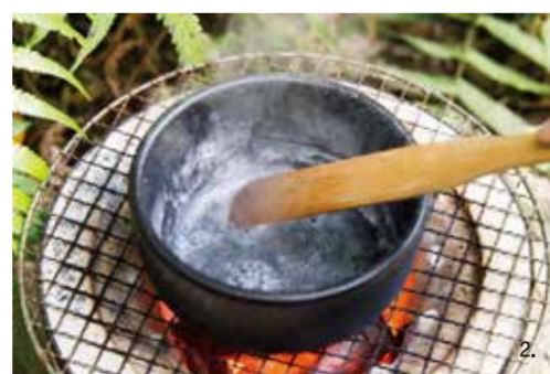
「石垣の塩 工房」 石垣市新川1145-57 ☎ 080-6482-8711 https://www.ishigakinoshio.com/