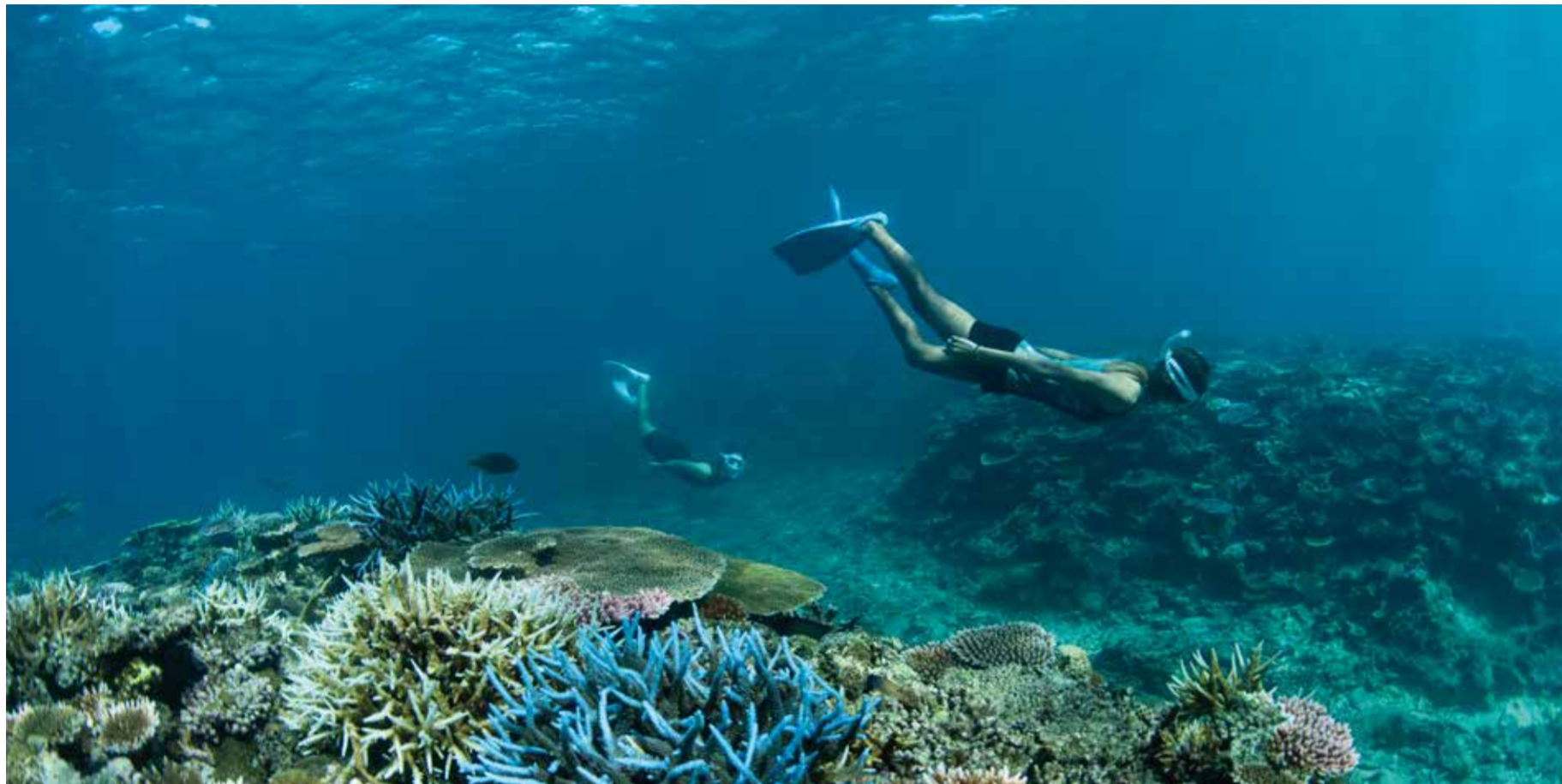
写真はフサキビーチのシュノーケルポイントにて撮影。2024年秋に行われた調査においてフサキビーチ沖の海域における珊瑚の生育状況が極めて良好であるとの報告が得られています。 ※実際のシュノーケリングツアーではライフジャケットの着用が必要です。