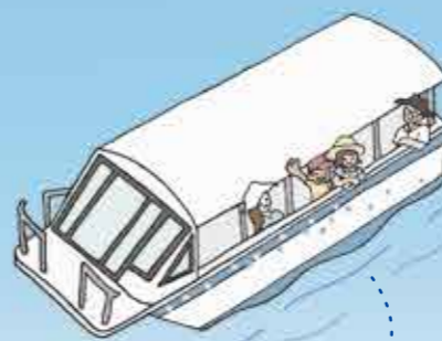
GLASS BOTTOM BOAT

*フサキビーチリゾートの全敷地面積は約86,000㎡。ビーチは全長約1km。 刻々と移ろう風景を望む「エンジェルピア」や、島の植栽豊かな「あやばにの森」など、 ゆっくり歩くと40分ほどの散歩コースを幾通りにも楽しんでいただけます。 ご滞在中当マップを片手に、フサキビーチウォーキングに出かけてみませんか？