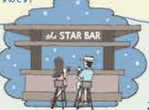
THE STAR BAR

夏の夜、線香花火のような 可愛らしい花を咲かせ、 明け方には散ってしまう 「サガリバナ」。 見頃は7月後半くらいまで。