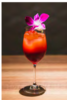
サンセットアイランド