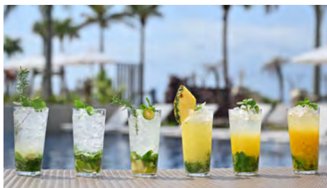
左から、しまモヒート、クラシックモヒート、シークワサーモヒート、パイナップルモヒート、パッションフルーツモヒート、マンゴーモヒート

世界各国で人気がある、夏の定番カクテル「モヒート」に南国らしいフルーツや石垣島ならではの材料を加えて、ここだけでしか味わえないバラエティ豊かな6種類の「FUSAKIモヒートセレクション」をご用意しました。