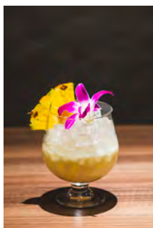
ヴァージン ピニャ・コラーダ