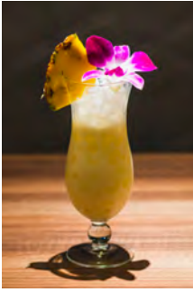
ピニャ・コラーダ